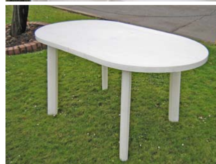
Mesa Saint Moritz